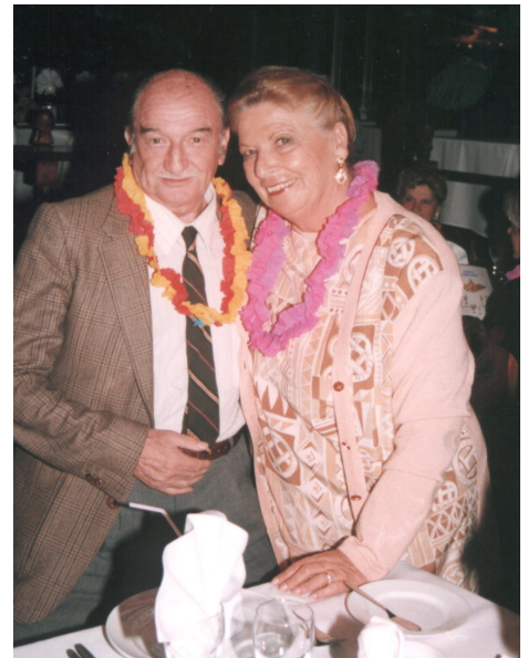
Pirata junto a una cautiva francesa de visita en Chile

Controvertido personaje que lo llevó a ser muy querido por muchos y rechazado por otros, al parecer no habían términos medios.