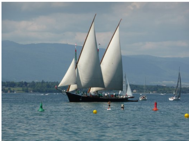
Antiguo velero del lago Lemán, restaurado por una fundación de amigos de la tradición marina

Berna, el barón Alfred von Rodt, haya establecido su residencia permanente en la isla de Robinson Crusoe, hasta su muerte, ni que 16 lagos cuenten con empresas de navegación, cuyos barcos transportan cada año a más de un millón de pasajeros. El 1º de agosto, Suiza celebró su Día Nacional