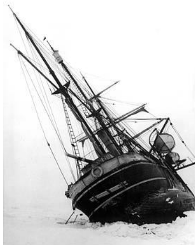
El bergantín Endurance , aprisionado en los hielos antárticos

Antes de llegar a la bahía de Vahsel, el 15 de enero de 1915 el Endurance quedó atrapado en el hielo del mar de Weddell. A pesar de los esfuerzos por liberarlo, se fue a la deriva hacia el norte en un témpano. Finalmente, el hielo aplastó y hundió el barco, dejando sobre el hielo a los 27 hombres de la tripulación. Estos se vieron sometidos a una serie de duras pruebas: meses de espera en campamentos improvisados sobre el hielo; un viaje en botes salvavidas a la Isla Elefante, la más septentrional de las Shetland del Sur; una segunda travesía de 1300 kilómetros en un bote abierto, el James Caird ; y tener que atravesar a pié las montañas de Georgia del Sur. Allí alquiló un pequeño ballenero, el Southern Sky , pero agotó todo el combustible tratando de penetrar en la banquisa para acercarse a isla Elefante.