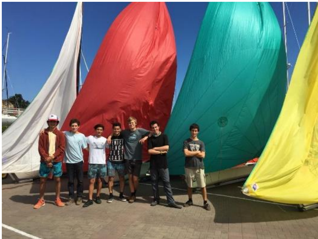
Participantes chilenos en la regata de Gdynia

Esperamos que nuestros jóvenes competidores debieran sentirse como en casa con un apoyo local.